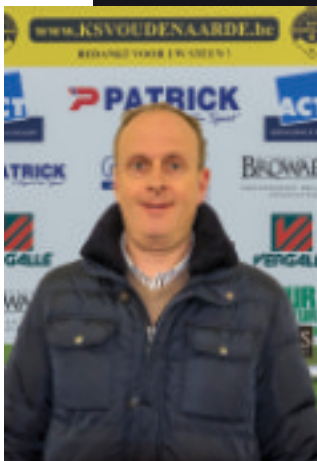
BROWAEYS TOM Projects