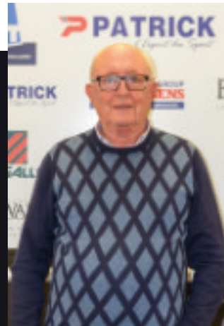
AUDOOR LUC Commercieel . Feestelijkheden